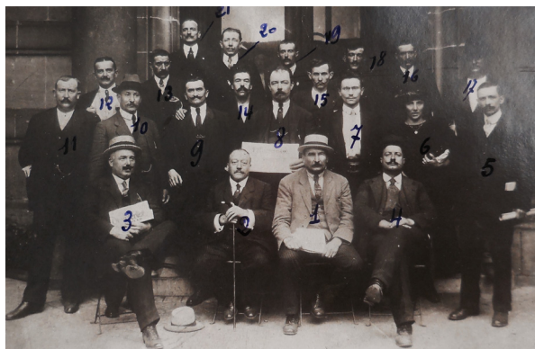
Les délégués de l'UD des syndicats de la Loire au XVI e congrès CGT (Lille juillet 1921). Les numéros reportés sur le cliché correspondent au repérage des militants par les services de police, (ADL, 10M443)